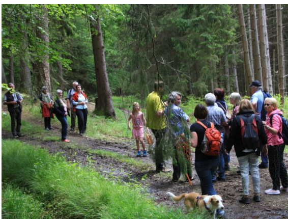
Danach wird gewandert.