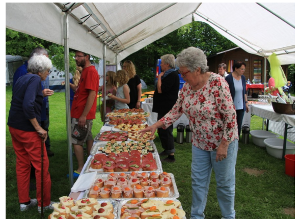
Die Fachgruppe Günthersmühle hat hervorragend für das leibliche Wohl gesorgt.