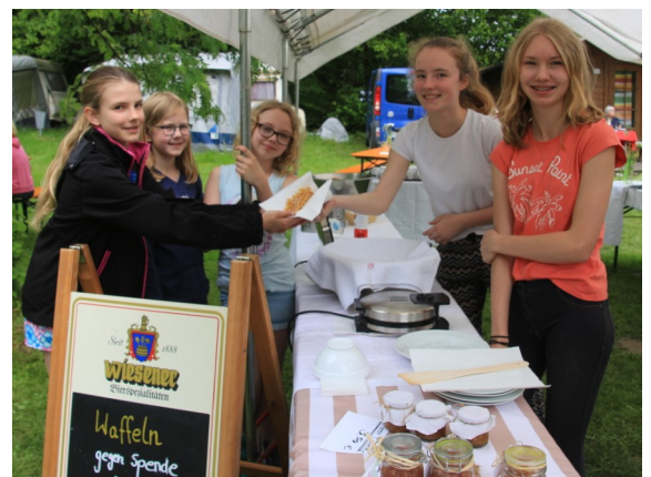
Unsere Kids haben Waffeln gegen Spende für das Sanitärgebäude angeboten.

Im Bläddsche 4/2018 wurde bereits über den Natura Trail informiert. Mehr Infos dazu auch auf unserer Homepage www.naturfreunde-offenbach.de