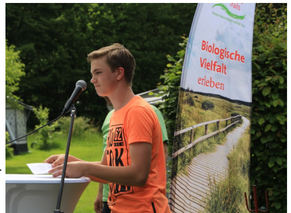
Schüler der „Alteburg Schule“ zu der smartphongeführten Tour