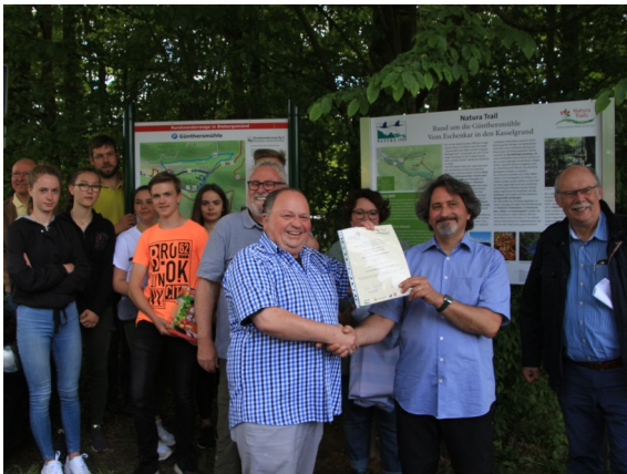
Die Tafel wird enthüllt und der Natura Trail eröffnet