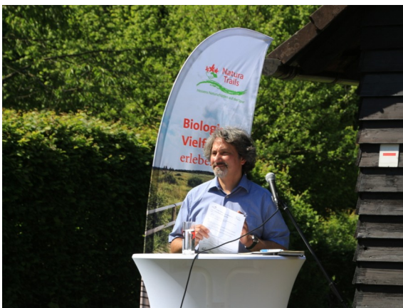
Johannes bei der Eröffnungsrede.