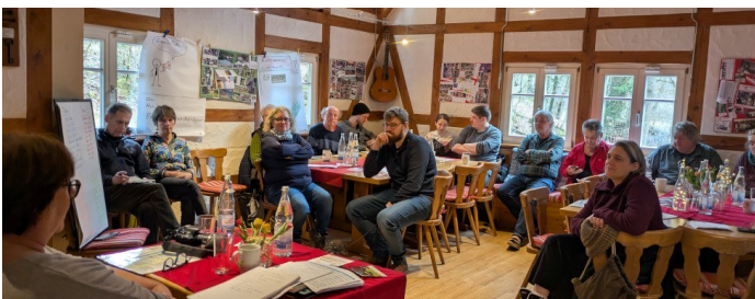
Tina berichtet über Neuerungen ...