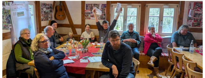
... leider nicht so gut besucht, wie wir es uns gewünscht haben