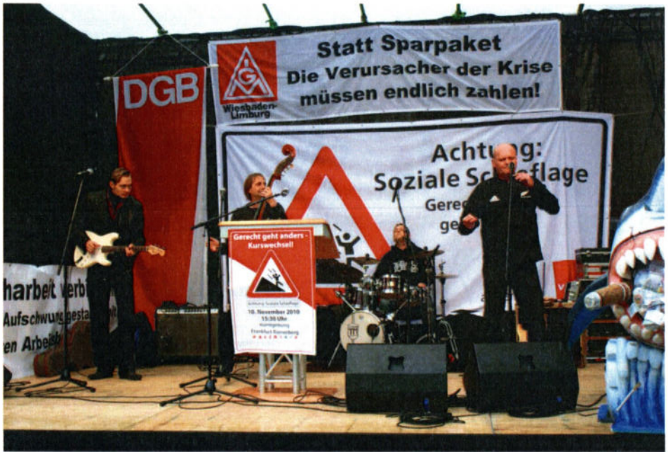
.....mit starker Beteiligung der Offenbacher NaturFreunde