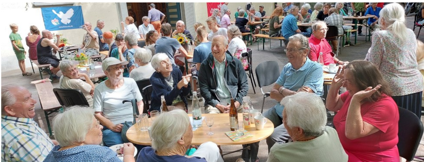
Die ehemalige Jugendgruppe amüsiert sich wie eh und je und beweist Sitzfleisch.